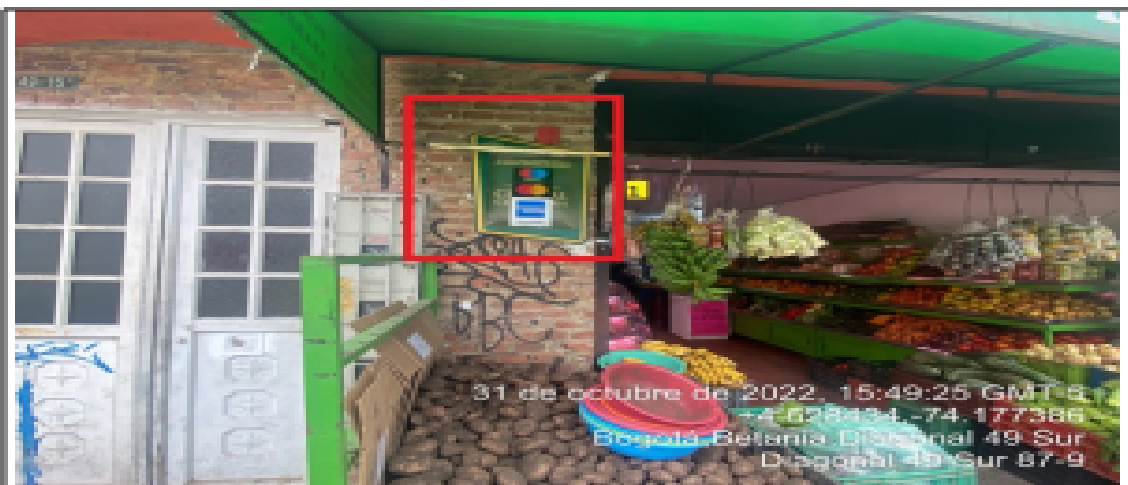
En la cual se evidencia un (1) elemento publicitario, perteneciente al establecimiento comercial AUTOSERVICIO Y SUPERMERCADO EL TRIGAL , el cual es adicional al único elemento permitido por fachada de establecimiento.