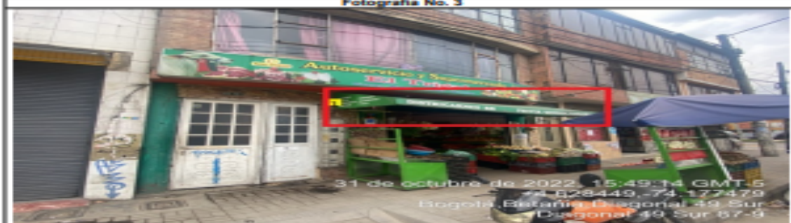
En la cual se evidencia un (1) elemento no regulado (carpa) que contiene publicidad, perteneciente al establecimiento comercial AUTOSERVICIO Y SUPERMERCADO EL TRIGAL , el cual se encuentra volado de la fachada y es adicional al único elemento permitido por fachada de establecimiento.