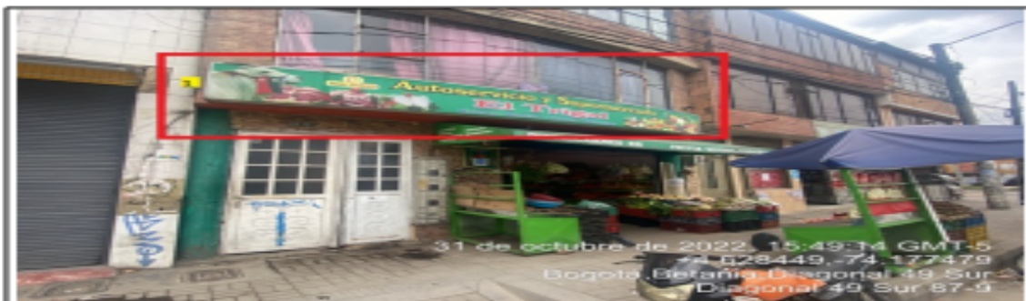
En la cual se evidencia un (1) elemento tipo aviso en fachada ubicado en arripicho de segundo piso perteneciente al establecimiento comercial AUTOSERVICIO Y SUPERMERCADO EL TRIGAL , el cual al momento de la visita se encontraba instalado sin el registro ante la SDA.